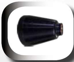
Tromblon permettant de cibler la base du feu.