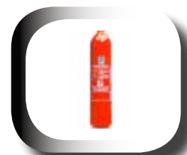
Bouteille forgée en acier léger à 250 bars, selon directive des appareils sous pressions 97/23/CE